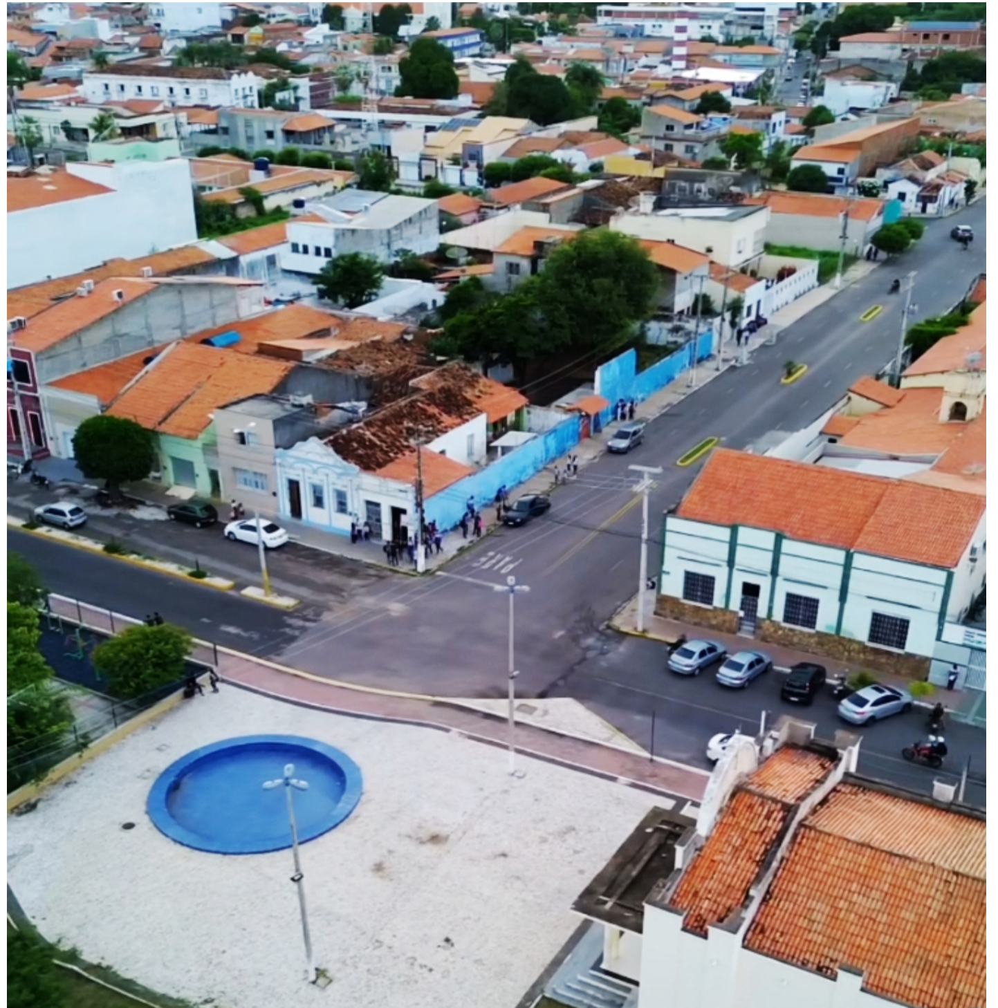
Crateús fez 192 anos no dia 6 de julho