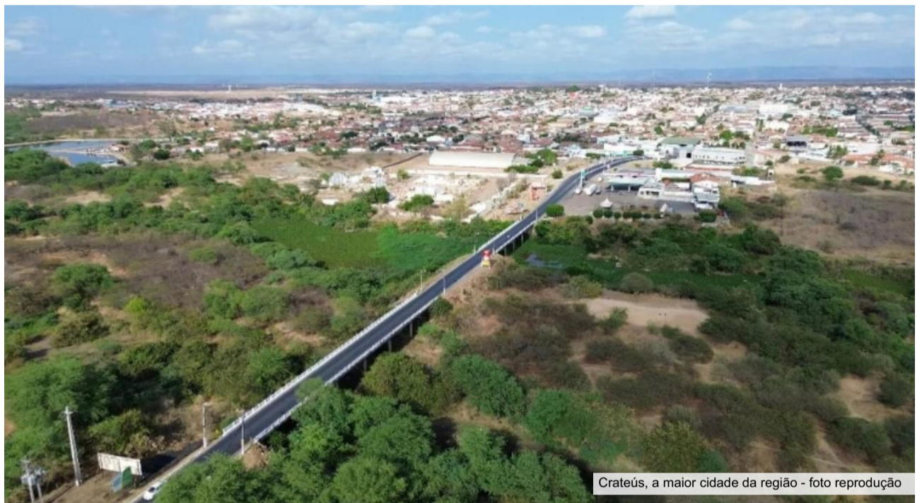
Crateús, a maior cidade da região

Nesses quase 60 dias, o cenário político local muda dia após dia, com a adesão de novos nomes à base do atual