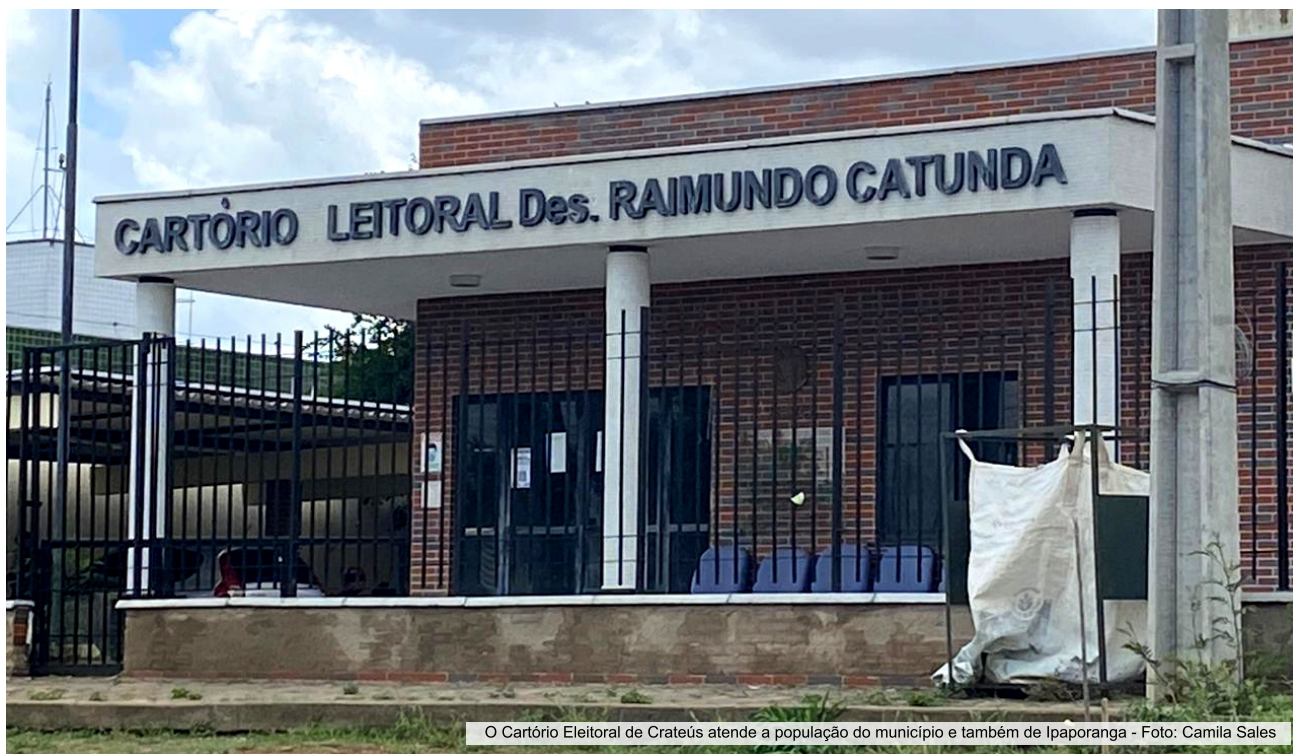
O Cartório Eleitoral de Crateús atende a população do município e também de Ipaoranga

Restam apenas três meses para o fechamento do cadastro eleitoral em 2024. O cidadão só tem até 8 de maio para regularizar o título e participar do processo democrático que ocorre neste ano, as eleições municipais. A recomendação é não deixar para a “última hora”. A princípio, é importante saber se está em dia com a Justiça Eleitoral, por meio do site do TRE ou no ou o aplicativo e-Título. No interior, a população poderá acessar os serviços nos cartórios eleitorais e em centrais de atendimento. Praticamente todos os municípios dos sertões de Crateús/Inhamuns possuem Cartório Eleitoral.