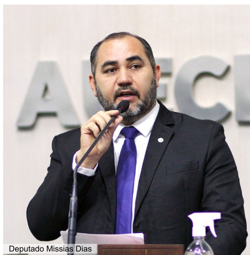
Deputado Missias Dias

Temas como as eleições municipais, a segurança pública, a estiagem, a geração de emprego, entre outros devem pautar os debates ao longo de 2024, conforme projetam deputados da Assembleia Legislativa do Estado do Ceará. E o possível quadro de seca em nosso