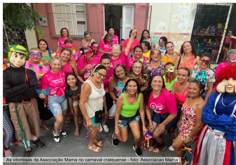
As vitoriosas da Associação Mama no carnaval crateuense

despertar a esperança nos corações, esperança de um futuro melhor e de muita cura e saúde que nos une na missão contra o câncer de mama”, relata a Associação.