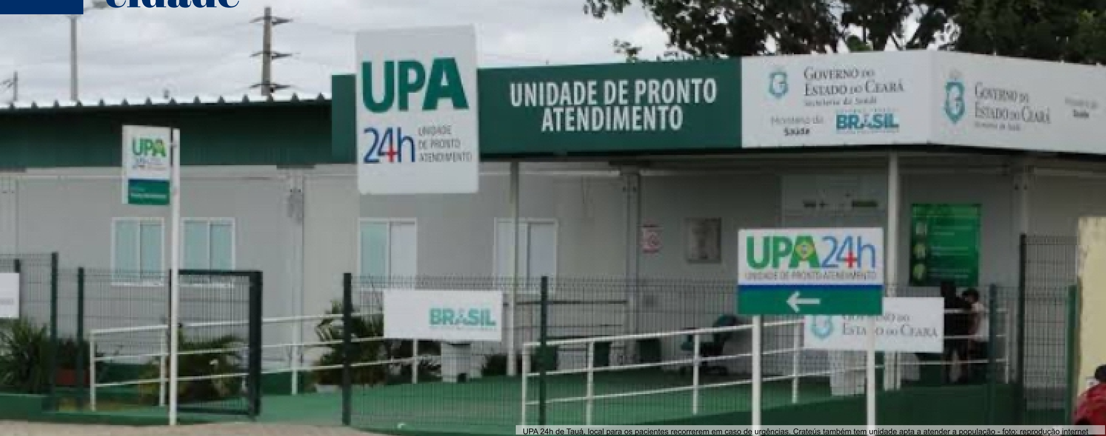
UPA 24h de Tauá, local para os pacientes recorrerem em caso de urgências. Crateús também tem unidade apta a atender a população - foto: reprodução internet