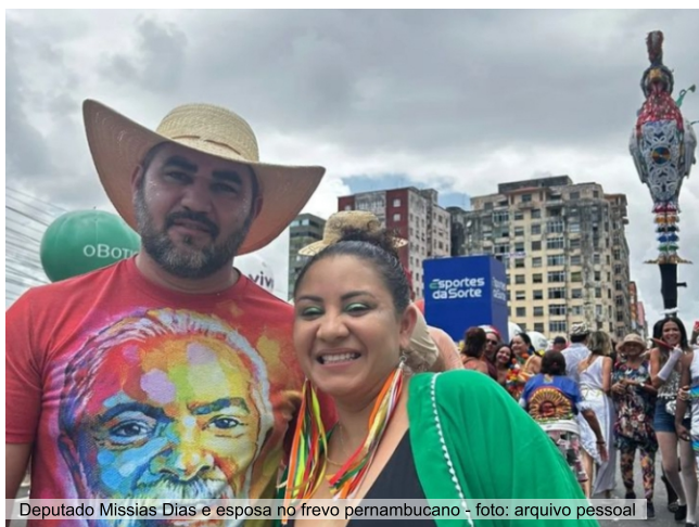
Deputado Missias Dias e esposa no frevo pernambucano

Já o deputado Missias Dias optou por curtir o frevo em Recife e Olinda, com a esposa e amigos.