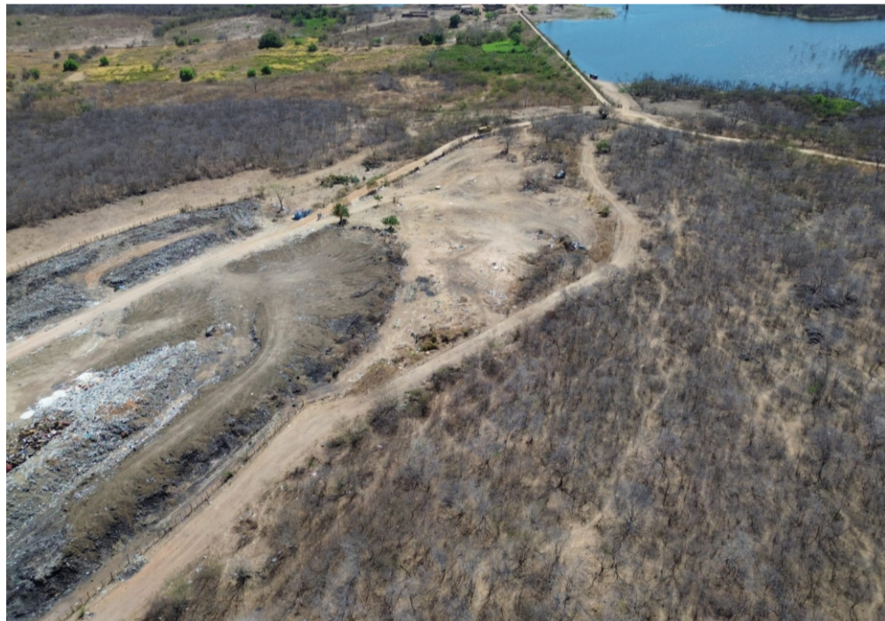
O lixão agora após a retirada das barracas

A partir deste mês eles passarão a receber a Bolsa Catador, no valor de R$ 400 mensais, incentivo existente desde 2012 no município, que funciona por meio de parceria com a Associação de Catadores de Materiais Recicláveis de Crateús (Recicratiui).