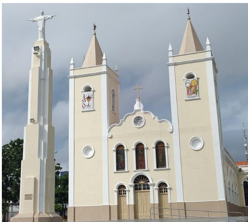
Catedral Senhor do Bonfim, sede da Paróquia