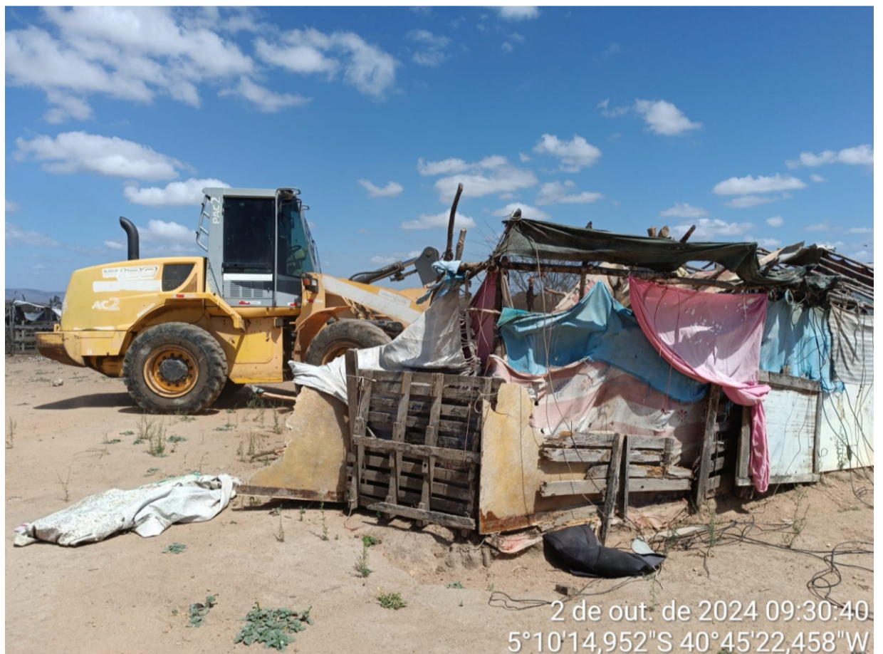
Barracas que residiam catadores foram derrubadas no lixão, no início deste mês

A partir deste mês de outubro Crateús começou a viver uma nova realidade no âmbito do meio ambiente, especificamente no que diz respeito ao trabalho e modo de vida dos catadores no “lixão” existente no município: os 23 catadores que viviam no lugar inóspito, trabalhando e morando, foram retirados no dia 2. Tudo começou com um Termo de Ajustamento de Conduta (TAC) emitido à gestão municipal pela 4ª Promotoria de Justiça de Crateús, em 18 de setembro. Conforme o TAC, providências urgentes deveriam ser tomadas pelo município: retirada imediata de todos os catadores de lixo e eventuais construções ilegais. Em Arneiroz também há determinação do MP com relação ao lixão.