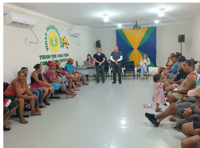
Reuniões dos órgãos envolvidos na ação conjunta com catadores

admissível a permissão de moradias no interior de lixão, fato que degrada a saúde e o bem estar dos catadores de lixos, devendo ser providenciado e/ou mantido o acompanhamento pela Secretaria de