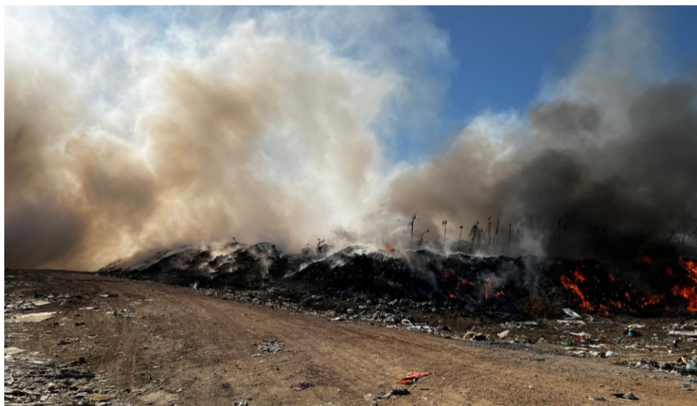
Incêndios que ocorrem com frequência no local, especialmente nos meses mais quentes

formação de gases inflamáveis, gerando incêndios. Situado a 10km da sede do município, o Lixão fica na zona rural, na localidade de Riacho dos Cavalos, em uma área de 15ha, delimitado por um perímetro de 2,120m.