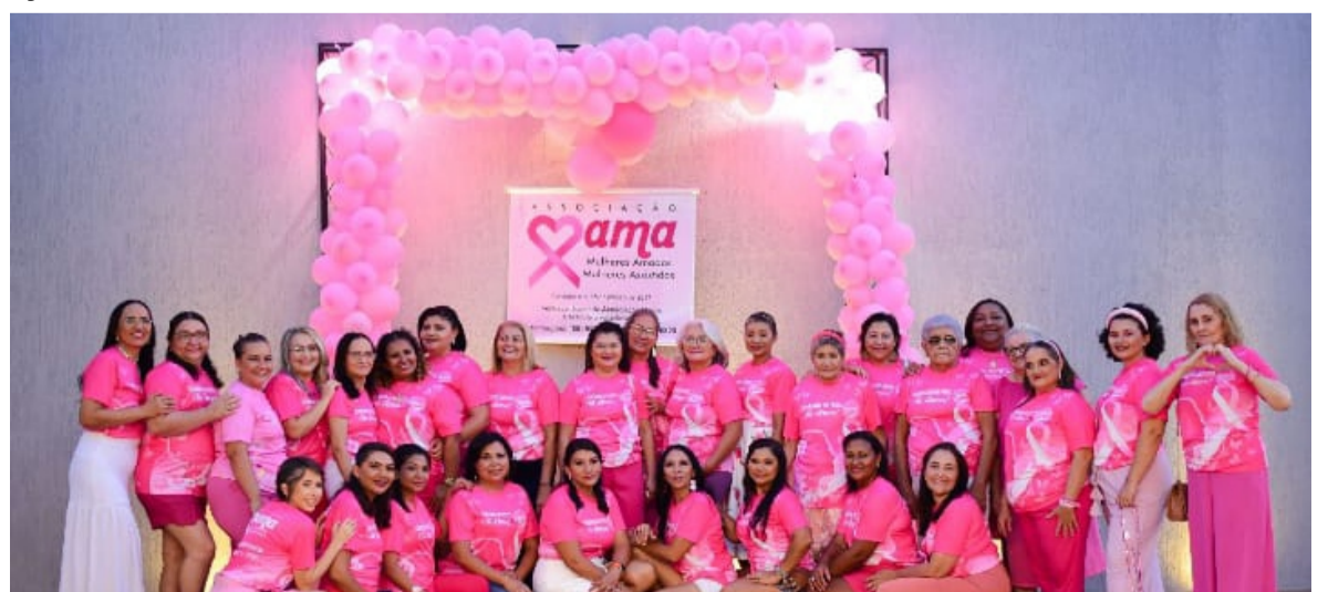
Grupo da Associação Mama

“A Associação Mama surgiu do anseio da Unimed de Crateús, empresa cooperativista sediada em nossa cidade, que busca realizar ações que intensifiquem o sétimo princípio do cooperativismo que é o INTERESSE PELA COMUNIDADE e como colaboradora da empresa, fui convidada e conseqüentemente e muito naturalmente, fui envolvida e tocada e me apaixonei pelo causa e propósito”