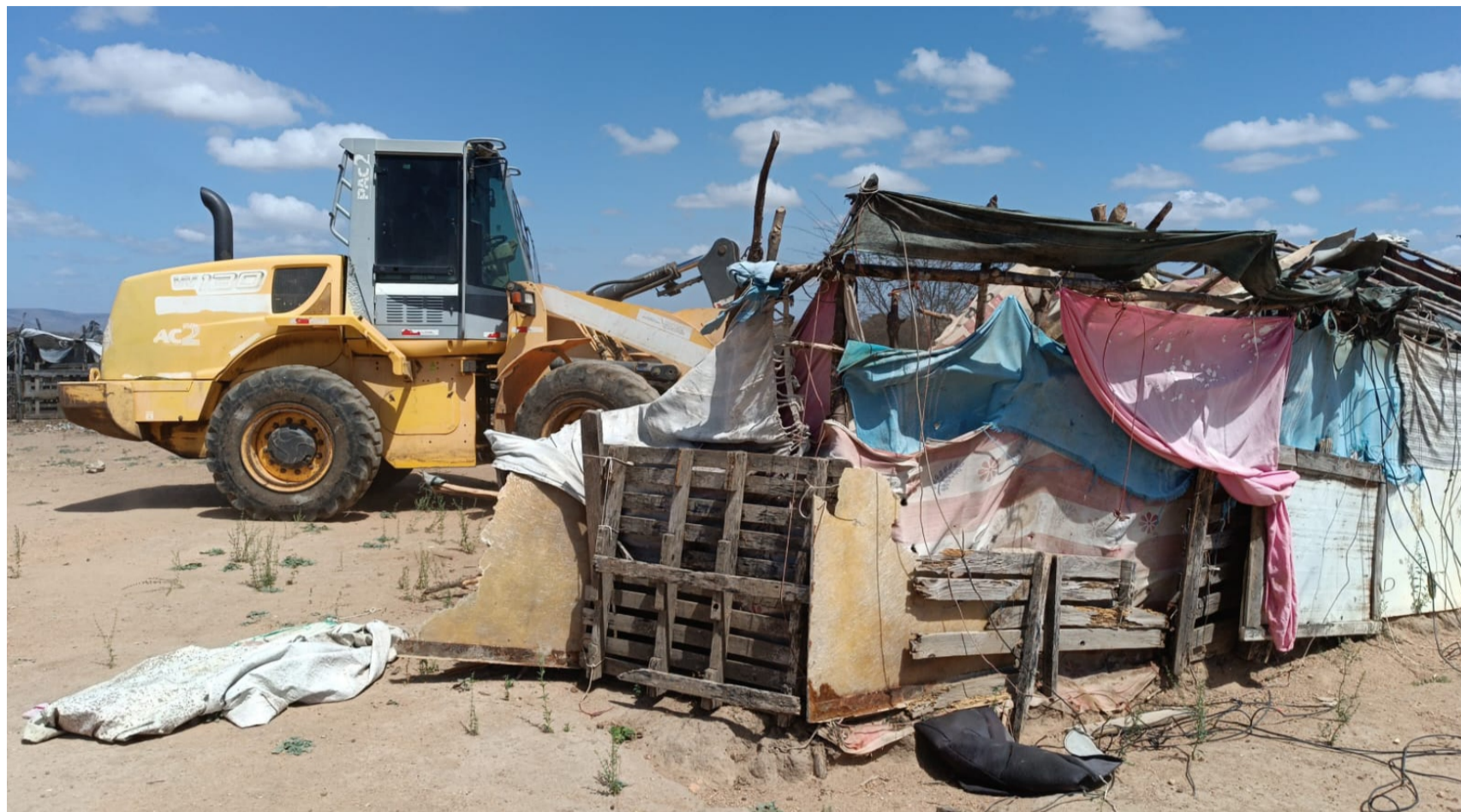
Momento de derrubada das barracas