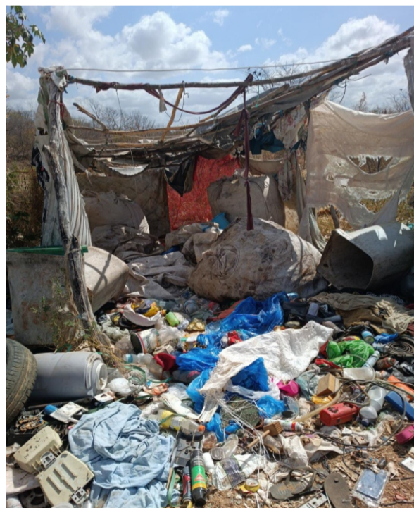
Essa era a situação de moradia das pessoas

A partir deste mês de outubro Crateús começou a viver uma nova realidade no âmbito do meio ambiente, especificamente no que diz respeito ao trabalho e modo de vida dos catadores no “lixão” existente no município: os 23 catadores que viviam no lugar inóspito, trabalhando e morando, foram retirados no dia 2, pela gestão municipal. O objetivo é que passem a viver dignamente em moradia normal, fora do local de trabalho diário. Tudo começou com um Termo de Ajustamento de Conduta (TAC) emitido à gestão municipal pela 4ª Promotoria de Justiça de Crateús, em 18 de setembro, assinado pelo Promotor de Justiça Lázaro Trindade de Santana