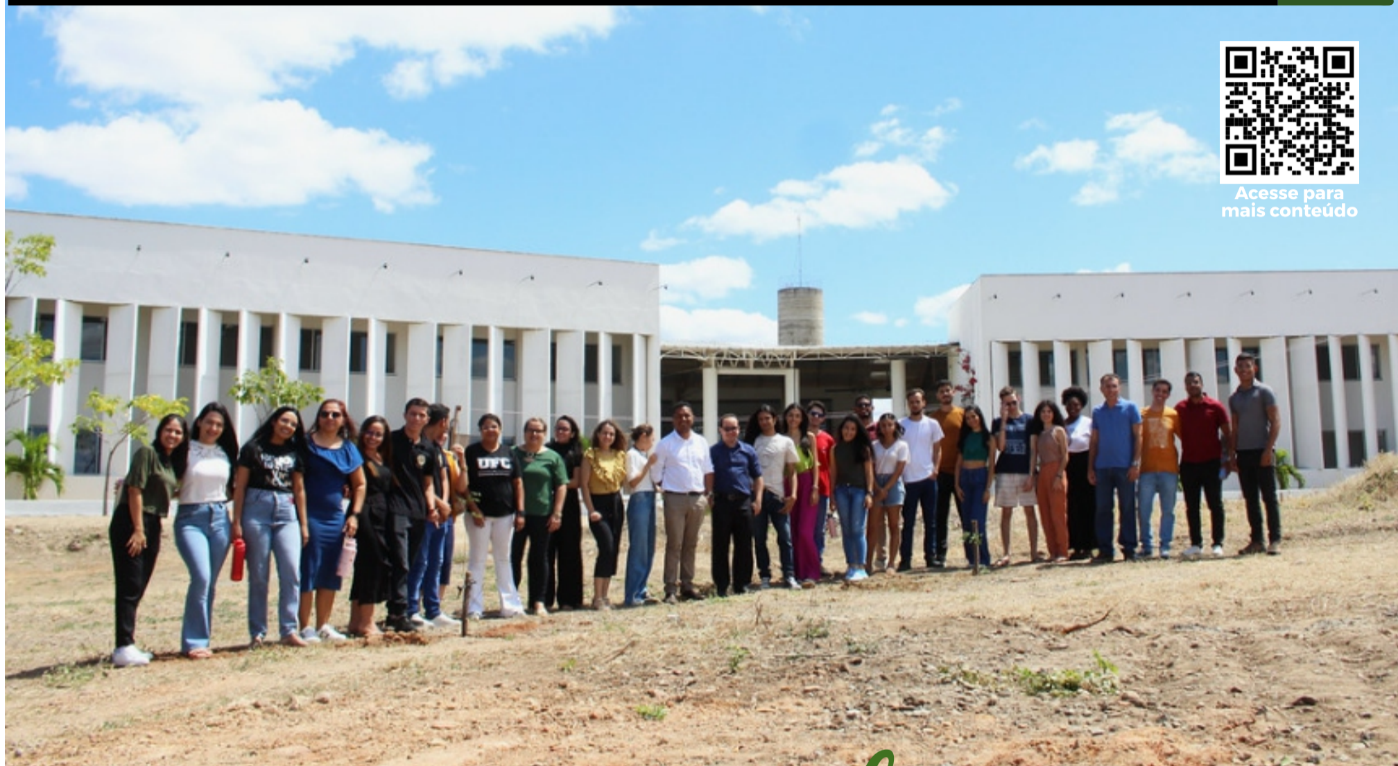
Comemoração dos 10 anos do Campus de Crateús