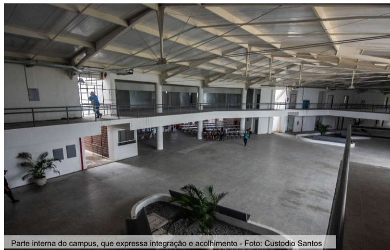
Parte interna do campus, que expressa integração e acolhimento

Coube a nossa equipe de arquitetos a tarefa da elaboração da proposta Urbanística do Campus Universitário como também o Projeto Arquitetônico dos edifícios para abrigar o início dos cursos.