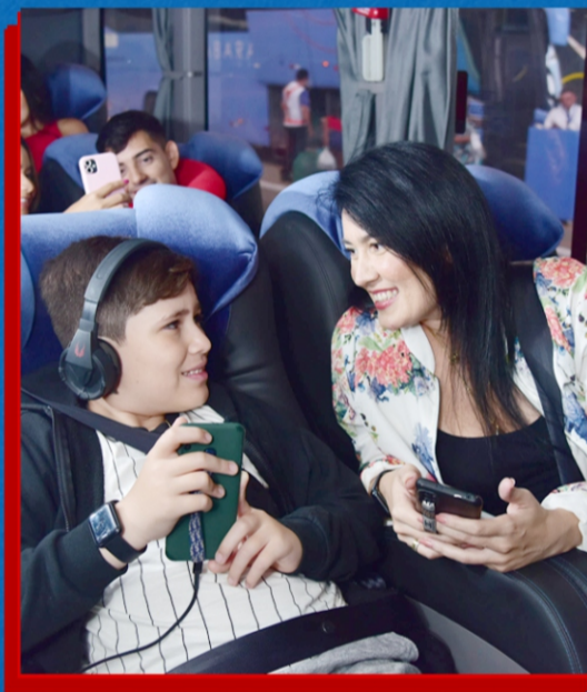
Poltronas com ampla reclinaco

Chegue ao seu destino com todo conforto, segurana e rapidez.