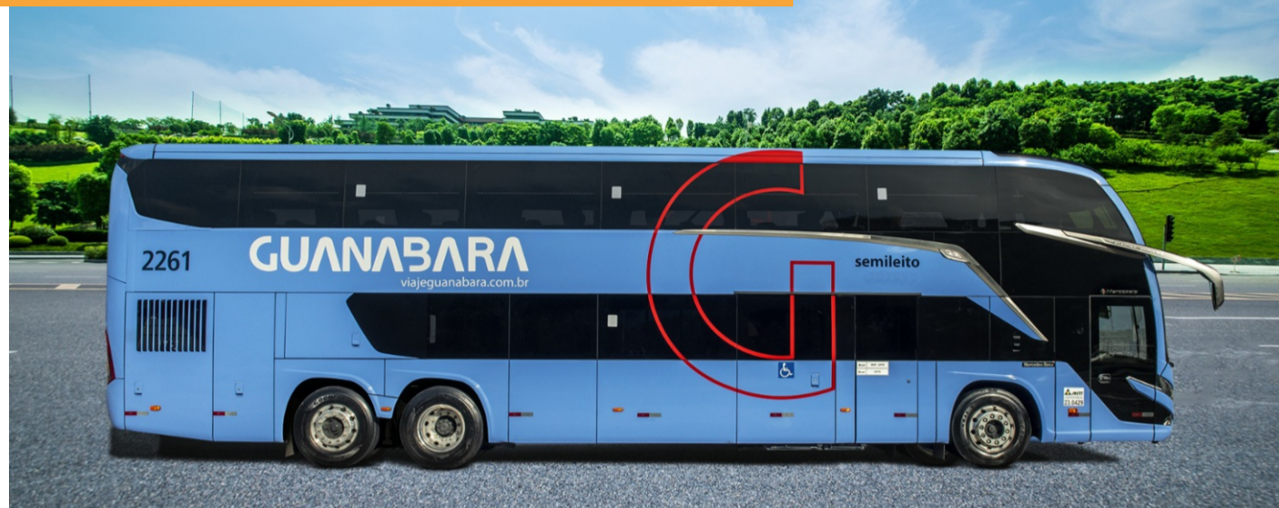
Mais conforto e segurança em suas viagens proporcionada pela Guanabara

Um dos grandes diferenciais da frota são os avançados sistemas de segurança. Os novos ônibus da