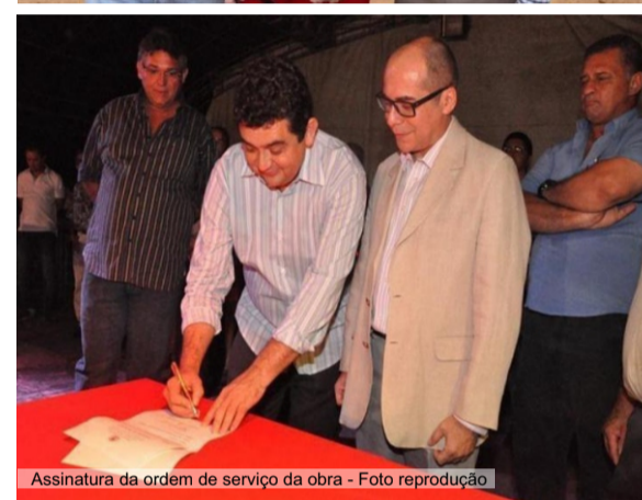
Assinatura da ordem de serviço da obra - Foto reprodução

O Campus da Universidade Federal do Ceará (UFC) em Crateús iniciou suas atividades no segundo semestre de 2014, operando provisoriamente nas instalações do Colégio Primeiro de Janeiro. Com o aumento no número de alunos, tornou-se inviável manter as aulas no colégio, o que levou à mudança para o atual espaço do campus em 2016. Inicialmente, apenas o bloco administrativo foi ocupado, pois o bloco acadêmico ainda estava em construção.