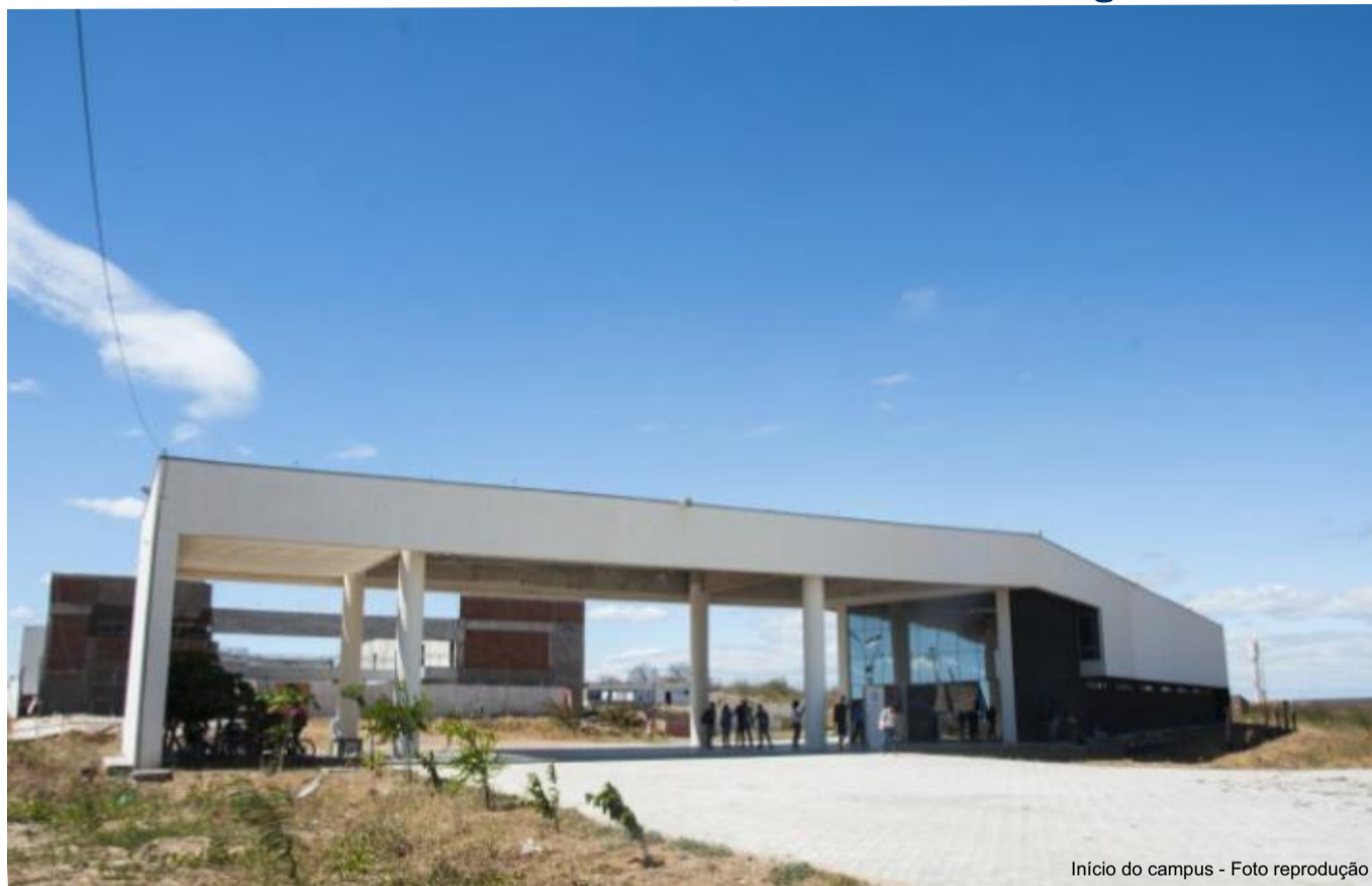
Início do campus - Foto reprodução