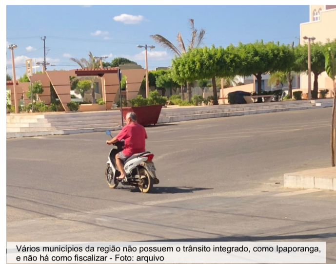
Vários municípios da região não possuem o trânsito integrado, como Iraporanga, e não há como fiscalizar