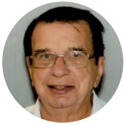
Por : Flávio Machado e Silva - Historiador, membro da Academia de Letras de Crateús