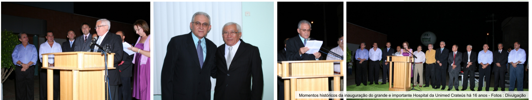
Momentos históricos da inauguração do grande e importante Hospital da Unimed Crateús há 16 anos

Gerente Executiva da Unimed Crateús e membro do Conselho de Administração do Sicredi Ceará. Pedagoga. Especialista em Gestão de Cooperativa de Crédito - UFC e com MBA em Controladoria e Finanças pela USPESalq.