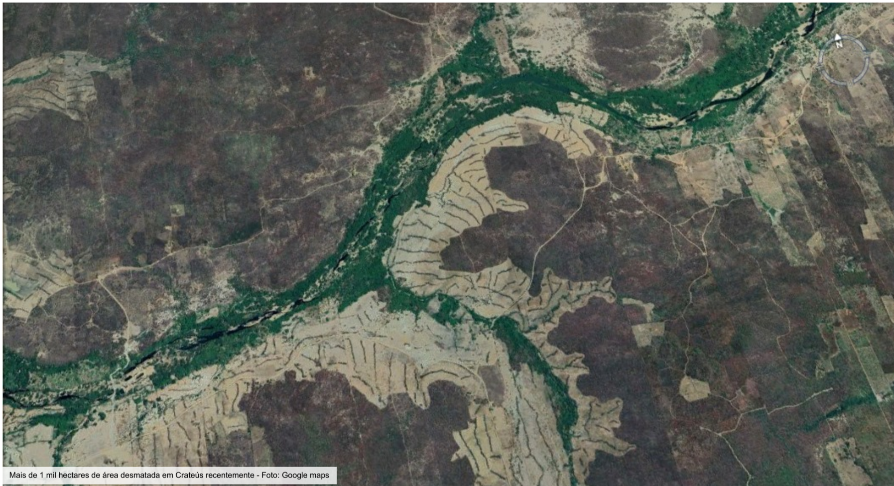
Mais de 1 mil hectares de área desmatada em Crateús recentemente

Muito do desmatamento que ocorreu em Crateús pode estar dentro da bacia hidrográfica do Açude Fronteiras; e expansão imobiliária também pode ser causa, analisam ambientalistas