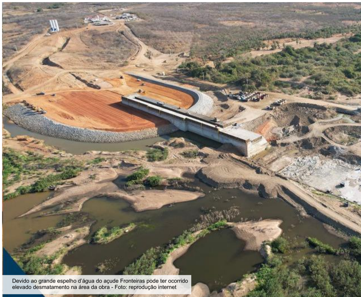
Devido ao grande espelho d'água do açude Fronteiras pode ter ocorrido elevado desmatamento na área da obra - Foto: reprodução internet

O Ceará teve um aumento de 13% da área desmatada entre os anos de 2021 e 2022. O dado foi apresentado já neste semestre em um seminário realizado pela rede colaborativa MapBiomias. Dos municípios cearenses, Crateús foi o que registrou maior desmate, com uma área afetada de mais de 1 mil hectares. O elevado número chamou a atenção. Algumas causas são apontadas pelos ambientalistas como forma de explicar o desmatamento ocorrido em Crateús nesses últimos anos. Muito do desmatamento pode estar dentro da bacia hidrográfica do Açude Fronteiras e expansão imobiliária também pode ser causa, analisam ambientalistas.