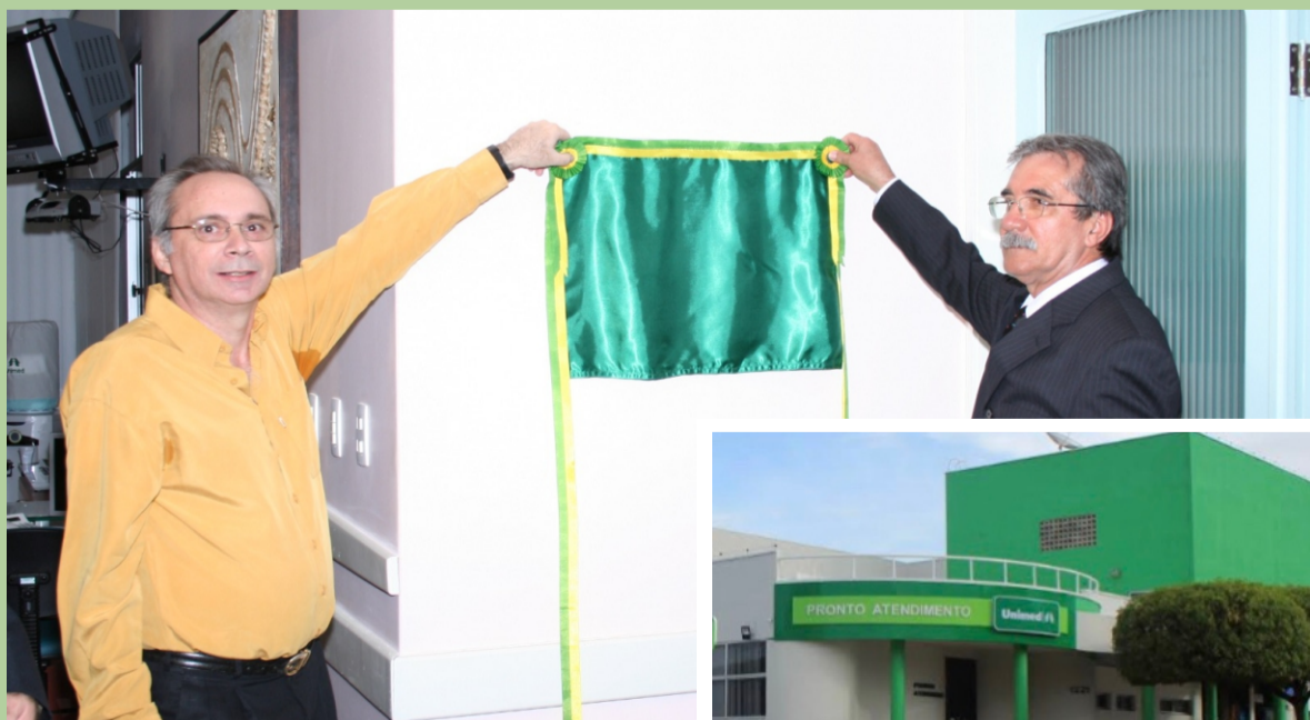
Hospital da Unimed, sonho realizado há 16 anos - Fotos: divulgação.