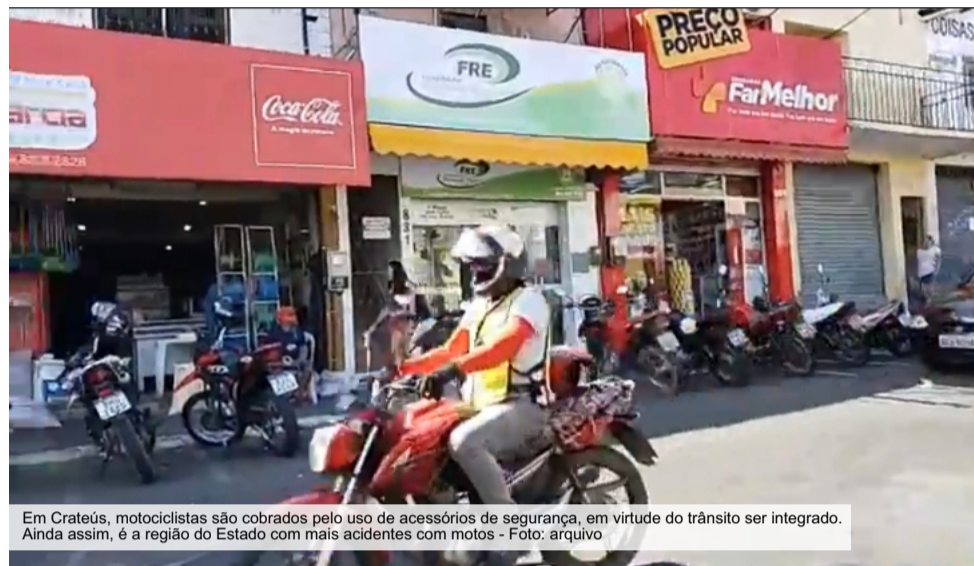
Em Crateús, motociclistas são cobrados pelo uso de acessórios de segurança, em virtude do trânsito ser integrado. Ainda assim, é a região do Estado com mais acidentes com motos

Acidentes com motociclistas são fatos bastante