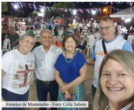
Festejos de Montenebo