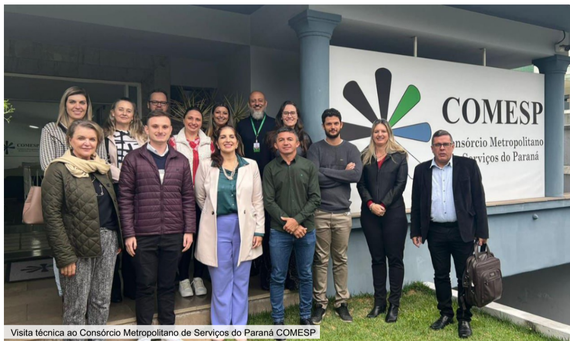
Visita técnica ao Consórcio Metropolitan de Serviços do Paraná COMESP

O CONRESOL - Congresso Sul-americano de Resíduos Sólidos e Sustentabilidade é uma realização do Instituto Brasileiro de Estudos Ambientais - IBEAS, em parceria com a Universidade Federal do Paraná - UFPR e da Associação Brasileira de Engenharia Sanitária e Ambiental - ABES Nacional.