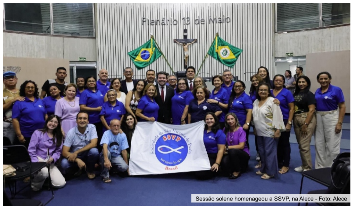
Sessão solene homenageou a SSVP, na Alece