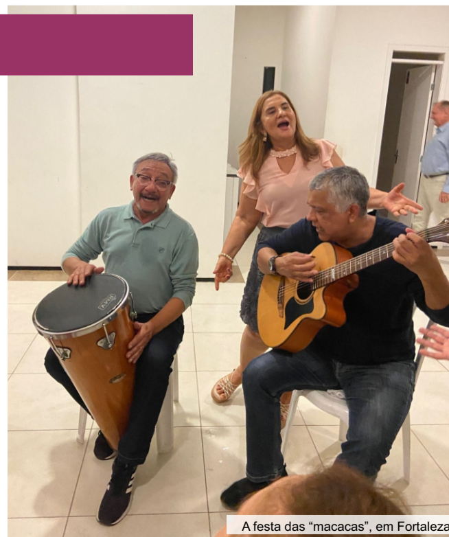
A festa das “macacas”, em Fortaleza