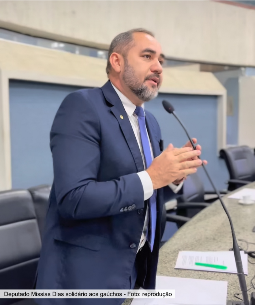
Deputado Missias Dias solidário aos gaúchos

O deputado Missias Dias (PT) se solidarizou, em pronunciamento em sessão plenária da Assembleia Legislativa do Estado do Ceará (Alece), com a população do Rio Grande do Sul atingida pelas enchentes.