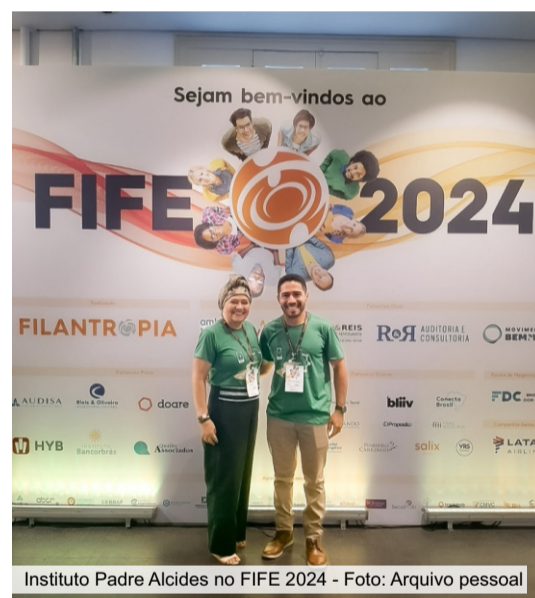
Instituto Padre Alcides no FIFE 2024

O Instituto Padre Alcides Tres, localizado na cidade de Monsenhor Tabosa, teve uma participação marcante no Fórum Interamericano de Filantropia Estratégica (FIFE), realizado em Belo Horizonte - MG.