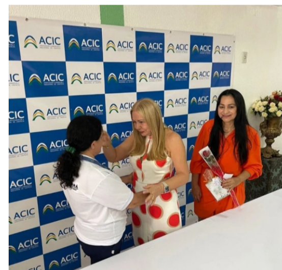
ACIC homenageia as mulheres pelo 8 de março

A Associação Comercial e Industrial de Crateús (ACIC) comemorou o Dia da Mulher, com momento festivo em sua sede. Mensagens e rosas foram destinadas às mulheres da Associação.