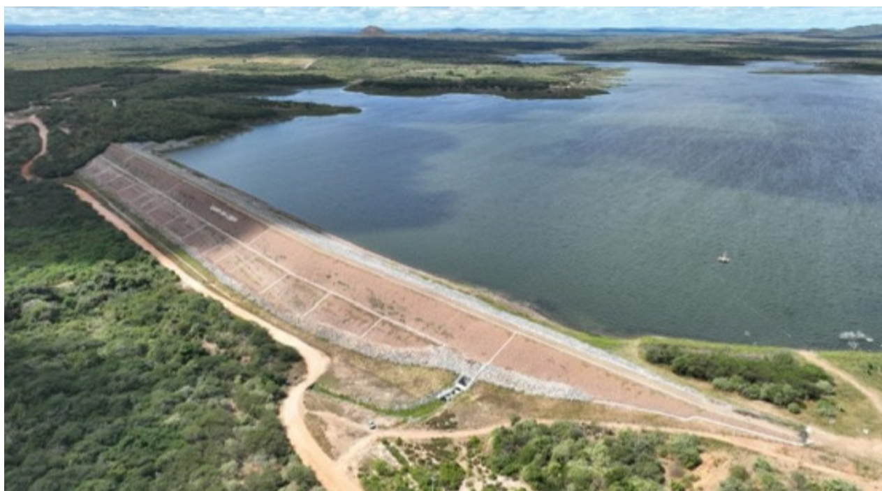
Reservatório Flor do Campo, em Novo Oriente, será focado na audiência pública

A Cogehr promove, entre os dias 20 a 22 de março, a Semana da Água 2024. Com programação extensa, as atividades têm como foco principal o tema “Água e Clima: Os impactos das mudanças climáticas e a gestão dos Recursos Hídricos”. Para os sertões de Crateús está prevista a realização de AUDIÊNCIA PÚBLICA SOBRE A AÇÃO DE MINERAÇÃO EM QUITERIANÓPOLIS E SEU IMPACTO NO RIO POTI E NO AÇUDE FLOR DO CAMPO, que ocorrerá no dia 22 de março, na Câmara Municipal de Novo Oriente - 8h.