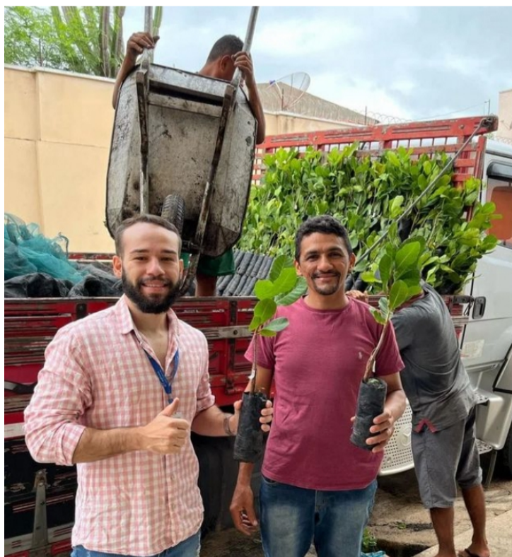
Cerca de 35 agricultores receberam mudas em Quiterianópolis

Neste mês, a Associação Municipal de Apicultores de Quiterianópolis, em parceria com o Governo do Estado, entregou mudas de caju anão precoce para agricultores e apicultores cadastrados no Programa Hora de Plantar. Foram beneficiados com a ação 35 agricultores, cuja entrega ocorreu na primeira semana de março.