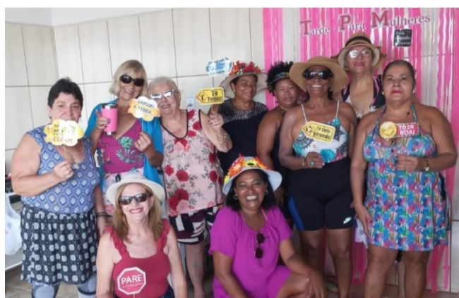
Amigas em Sampa