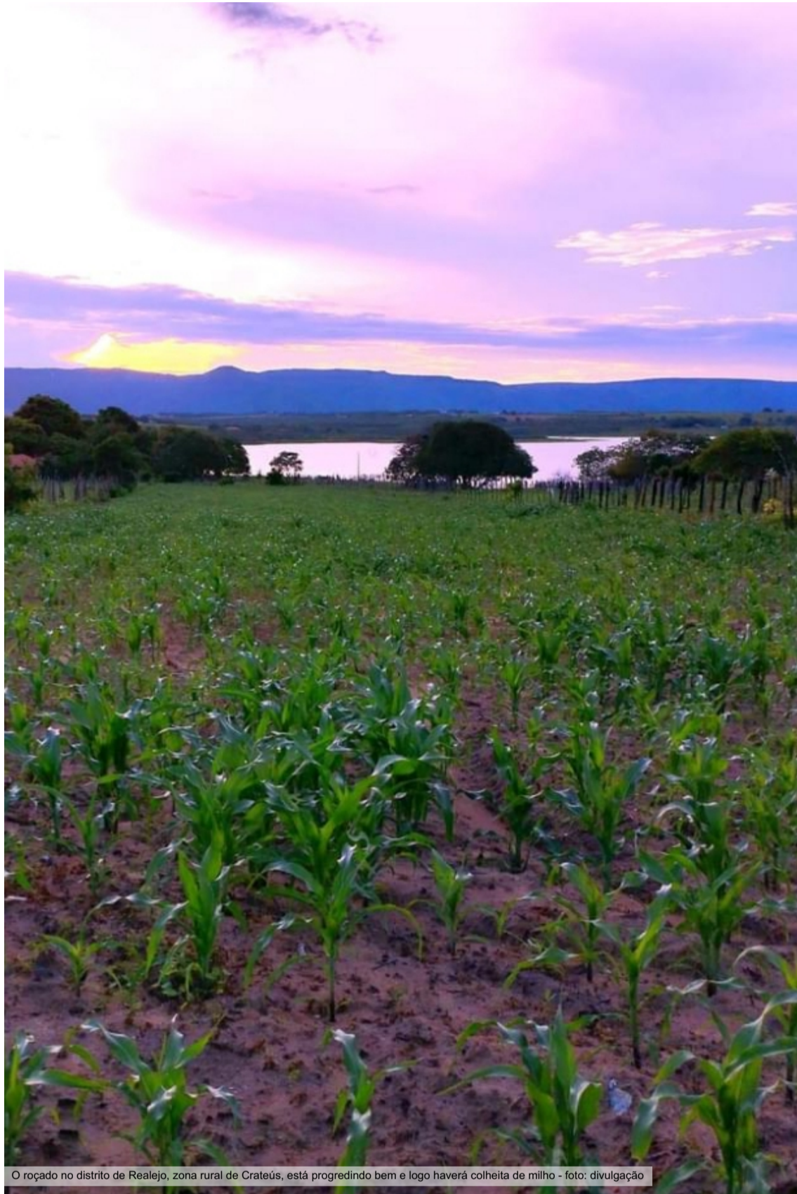
O roçado no distrito de Realejo, zona rural de Crateús, está progredindo bem e logo haverá colheita de milho