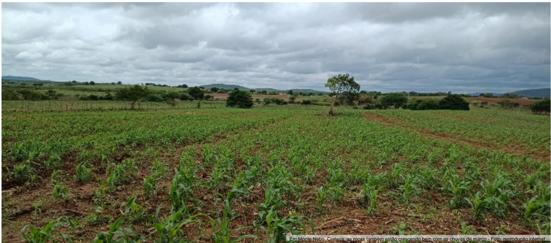
Em Monte Nebo, Crateús, as roças também estão crescendo bem com as chuvas de março